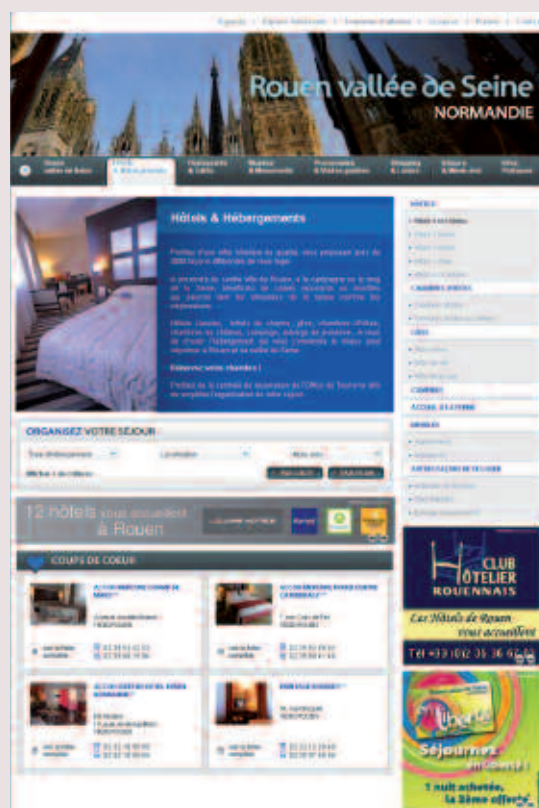
Page niveau 1