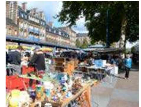
Marché au Clos Saint-Marc