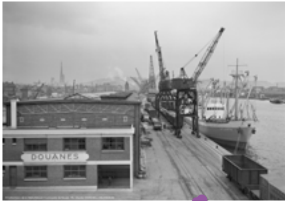
Quai de Seine - années 1950