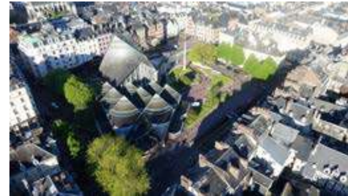
Toitures des halles du marché couvert et de l'église Sainte-Jeanne-d'Arc