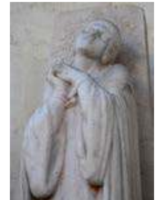
Statue de Jeanne d'Arc

L'église Sainte-Jeanne-d'Arc, ainsi que les halles du marché, sont inaugurées en 1979, sur les plans de l'architecte Louis Arretche. Cette église à l'architecture audacieuse permet d'admirer les vitraux du chœur de l'ancienne église Saint-Vincent, située jadis en bas de la rue Jeanne-d'Arc et détruite en 1944. Au milieu de la place, les vestiges de l'ancienne église Saint-Sauveur ont été dégagés. C'est dans cette modeste église paroissiale que Pierre Corneille est baptisé le 9 juin 1606.