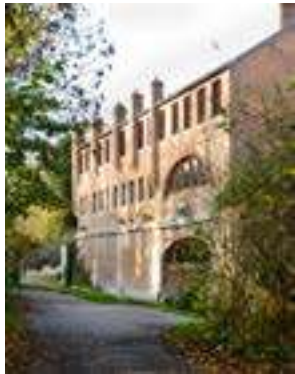
Ancienne teinturerie Auvray