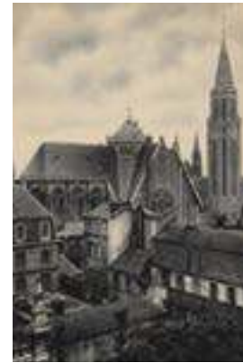
Eglise Saint-Nicaise