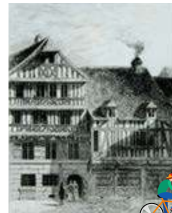
Maison des deux Corneille