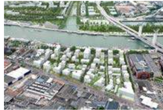
Vue axonométrique du projet du quartier Luciline