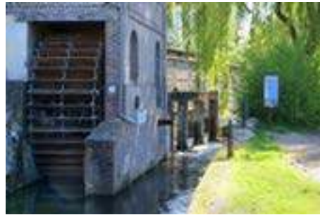
Moulin des Dames de Saint-Amand