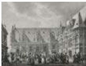
Palais de justice - Taylor et Nodier « Voyages pittoresques et romantiques en ancienne France » © Bibliothèque municipale de Rouen (U_49_4_pl164_d)