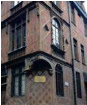
Bâtiment du 19 e siècle en pan-de-bois