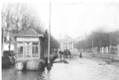
Avenue Pasteur vers 1910