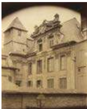
Eugène Atget, Hôtel Girancourt: 48 rue Saint-Patrice, 1907 © Bibliothèque municipale de Rouen, Est. rec. m 171-05.

De nombreux notables, siégeant au Parlement de Normandie, cour de justice de l'époque, s'installent dans le quartier Saint-Patrice où se construisent, dès le 17 e siècle, de somptueux hôtels particuliers. Ils évitent ainsi de se déplacer entre leurs terres, châteaux et manoirs, situés à la campagne et Rouen. Si l'église est ouverte, n'hésitez pas à entrer admirer les vitraux et l'ensemble la décoration (tableaux, mobiliers).