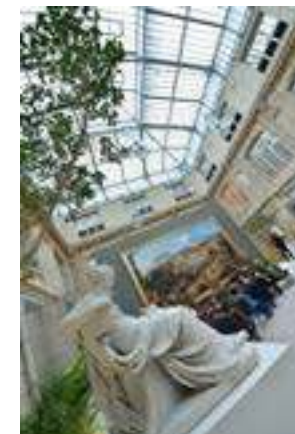
Intérieur du Musée des Beaux-Arts de Rouen