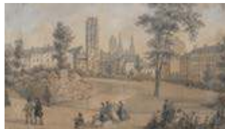
Square Verdrel vers 1860