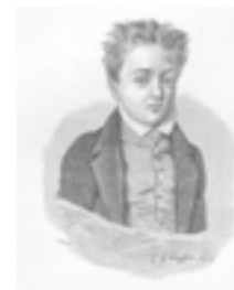
Portraits de Gustave Flaubert à différents âges