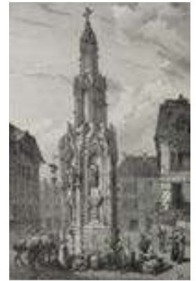
Gravure de l'ancienne fontaine de la Croix-de-pierre Taylor et Nodier « Voyages pittoresques et romantiques en ancienne France » © Bibliothèque municipale de Rouen (U_49_4_pl168_d)