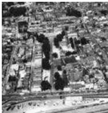
Avenue Pasteur vers 1970