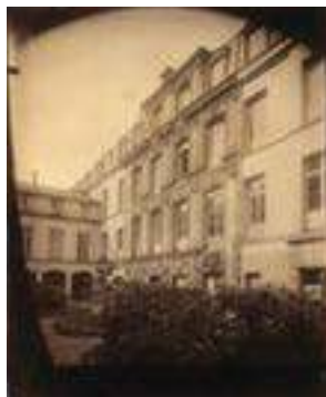
Eugène Atget, Cour de l'Hôtel d'Arras: 38, rue Saint-Patrice, 1907 © Bibliothèque municipale de Rouen, Est. rec. m 171-27.