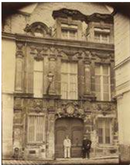
Eugène Atget, Hôtel d'Arras: 38, rue Saint-Patrice, 1907 © Bibliothèque municipale de Rouen, Est. rec. m 171-08