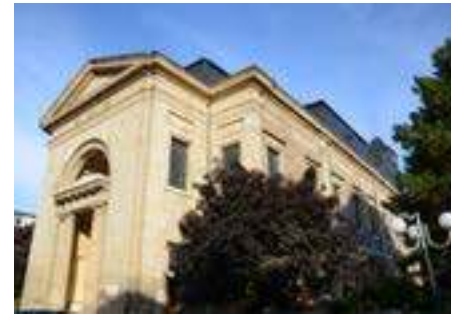
Chapelle Notre-Dame-de-la-Charité